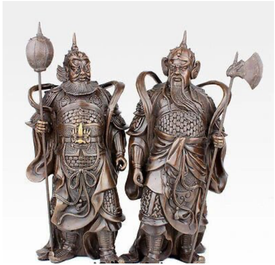
Figura 2 I due mensheng Yu Chigong e Qin Qiong

Anche regalare ai bambini monete in una busta rossa di carta è un’usanza diffusa a capodanno. I cinesi amano il rosso, perché simboleggia vitalità, gioia e fortuna. Il dono della busta di carta rossa a chi è giovane e non sposato, esprime un augurio di buona fortuna. Le monete all’interno della busta possono far contenti i bambini, mentre il significato principale consiste nel colore rosso, simbolo di fortuna.